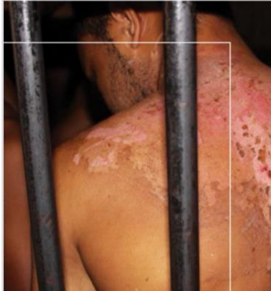
Imagem II- Registros de tortura em um dos detentos

condições desumanas, com lixo, esgoto e mau cheiro. Detentos relataram ter recebido punições de dez dias, mas muitos já estavam em isolamento há mais de 40