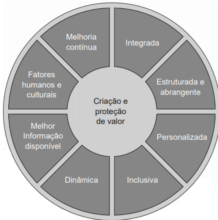
Figura 1 - Princípios da gestão de riscos