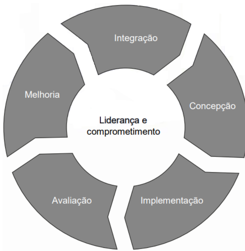
Figura 2 - Estrutura da gestão de riscos