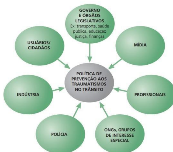
Figura 11: Grupos chaves para segurança no trânsito

Importa evidenciar que as responsabilidades no trânsito não podem ser pensadas somente individualmente, antes, devem ser compartilhadas por todos aqueles que dividem este espaço, do cidadão ao Governo Federal. A OMS (2012) compartilha que quanto maior o compartilhamento das responsabilidades dos grupos abaixo na construção de políticas de segurança, mais chances teremos de construir um trânsito seguro: