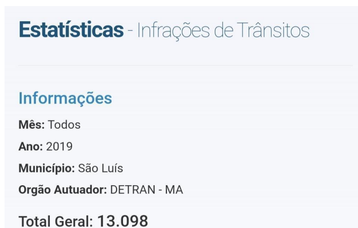
Figura 9 - Número de Infrações 2019