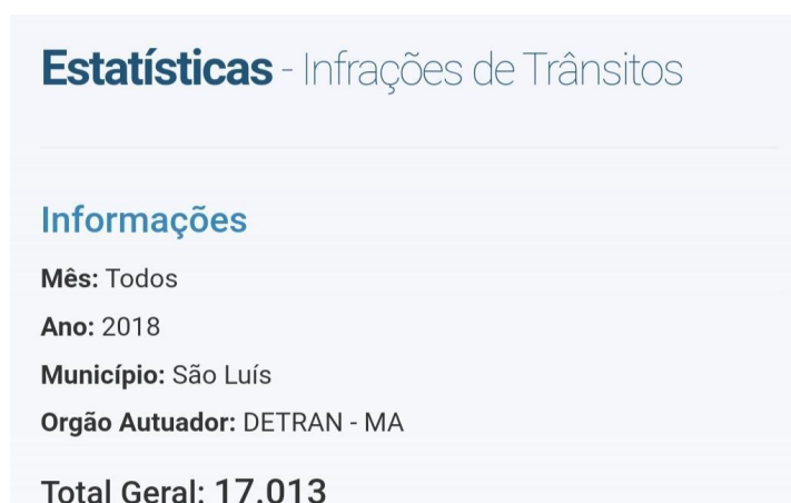
Figura 8 - Número de Infrações 2018