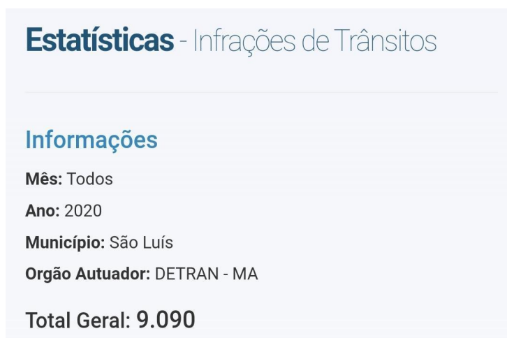
Figura 10 - Número de Infrações 2020