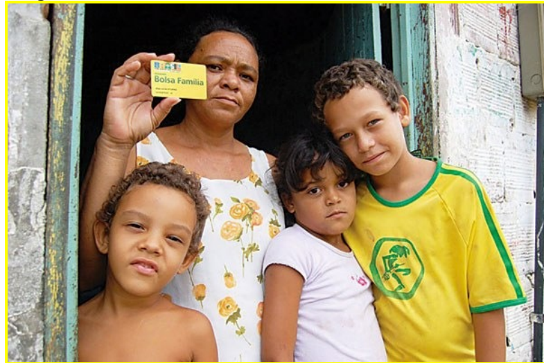
Figura 4 - Família de mãe-solo com benefício do Bolsa Família

sócio-cultural, ele se desenvolvia enquanto um ser sócio-cognitivo.